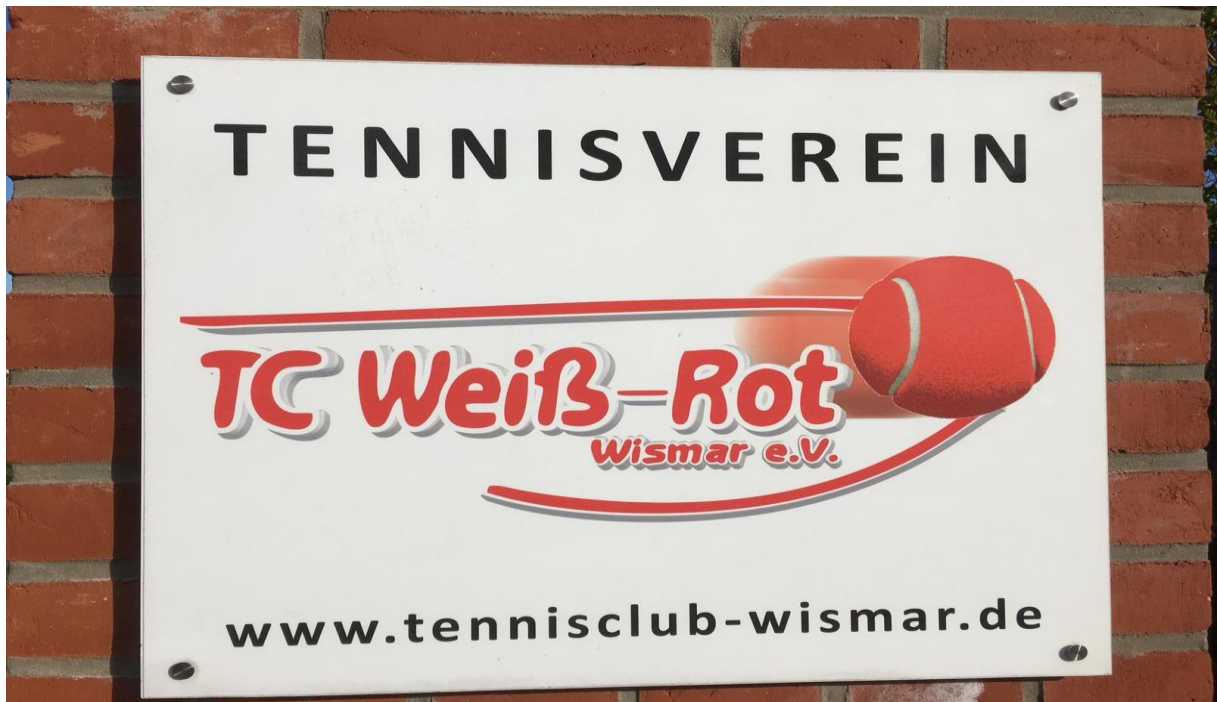
Das Vereinsschild am neue Einlaßtor in der Goethestraße

Auch bauliche Verbesserungen am und im Klubhaus wurden nach Vorschlägen und Modellen von Studenten der Hochschule Wismar ermöglicht. Eine neue Küche wurde von Mitgliedern des Tennisvereins eingebaut und ausgestattet. Der Klubraum wurde mehrere Jahre gemeinsam mit dem Fußballverein FC Anker Wismar genutzt.