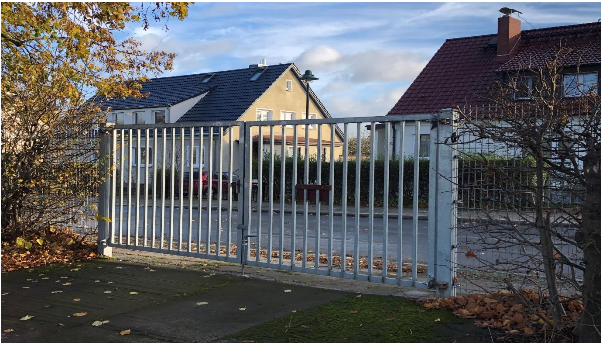
Das neue Eingangstor in der Dr. Unruhstraße

Weiterhin hat die Hansestadt Wismar einen modernen Zaun und ein neues Eingangstor an der Dr.Unruh-Straße gebaut.