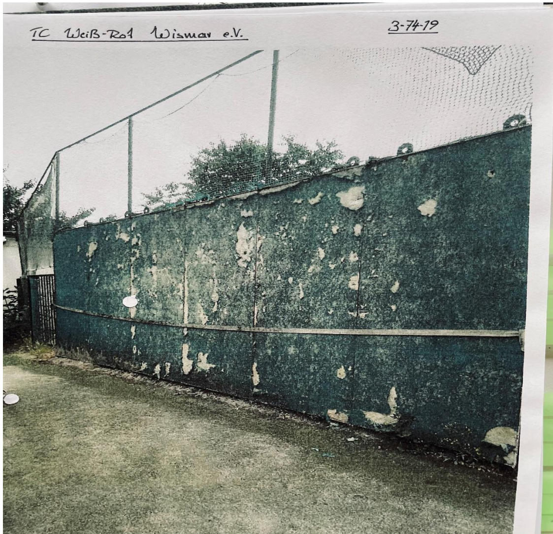
Die alte Betonballwand

Diese Maßnahme wurde ermöglicht durch einen mühsamen Prozess mit kommunaler Kofinanzierung, ELER-Hilfen der EU mittels Landesförderinstitut Schwerin und Verhandlungen mit der Sparkasse wegen kurzzeitiger Verschuldung. Denn der größte Anteil der Finanzierung durch EU-Mitteln musste erst vom Tennisverein ausgelegt und danach per Antrag wieder zurückbezahlt werden.